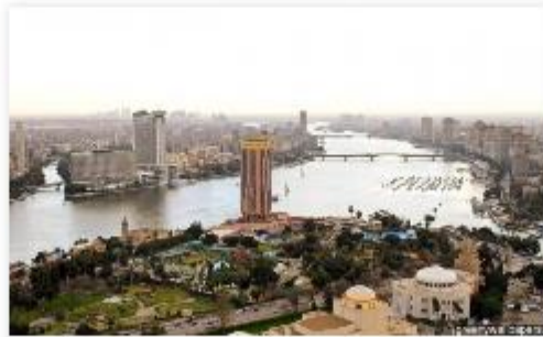
Egypt (Upper Egypt)