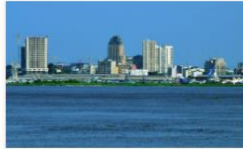
République démocratique du Congo