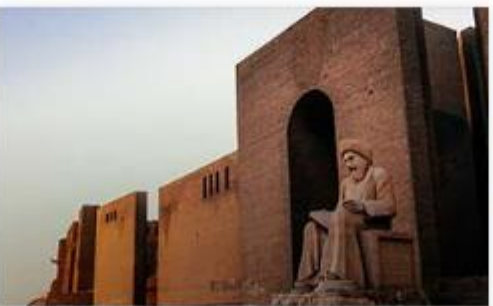
Iraq (Kurdistan Region)