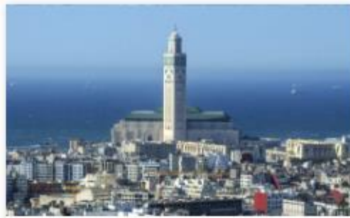
Morocco (Sports Orange Corners)